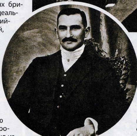
Оскар Джозеф Слейтер

говор по вердикту присяжных, был не согласен с такой мерой наказания и подал петицию на смягчение, которую подписали 20 тысяч человек. За двое суток до исполнения приговора смертную казнь Слейтеру заменили на пожизненное заключение.