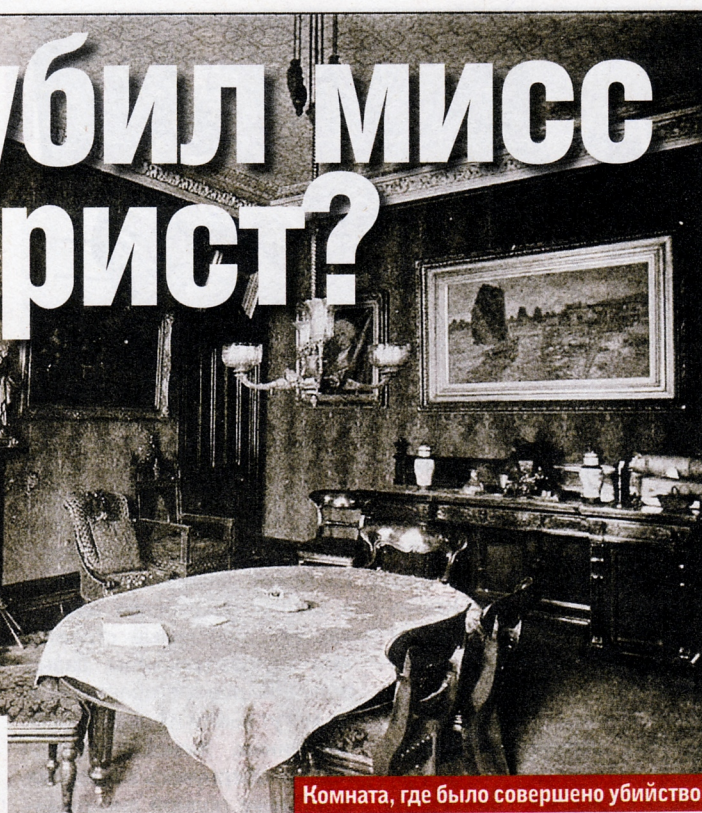
Комната, где было совершено убийство