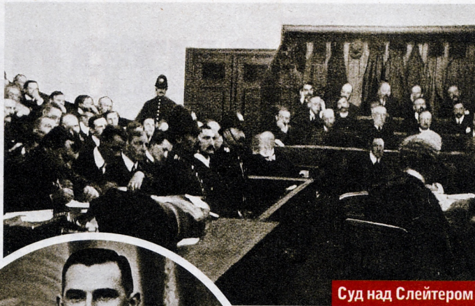
Суд над Слейтером